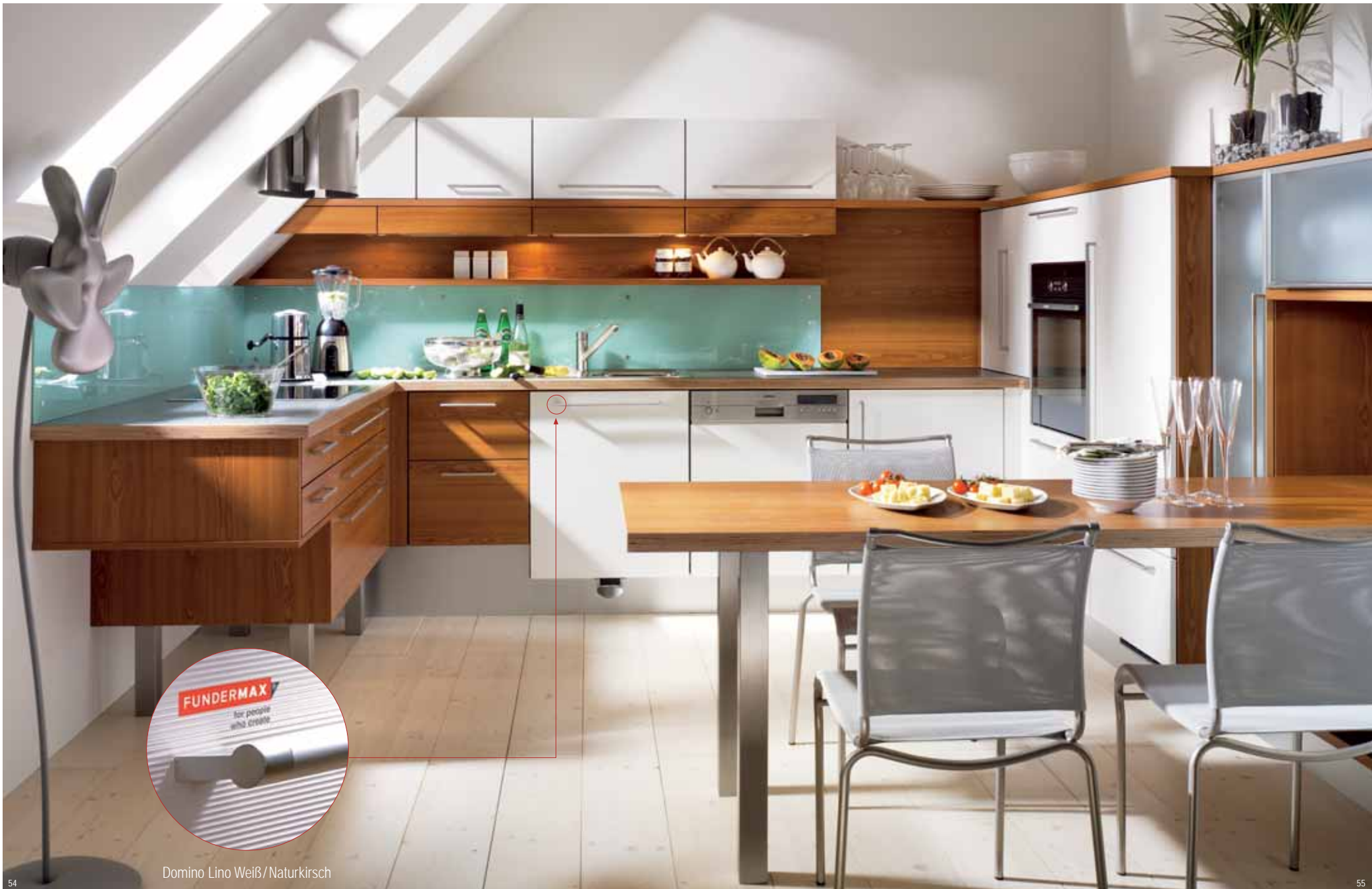
Domino Lino Weiß/Naturkirsch